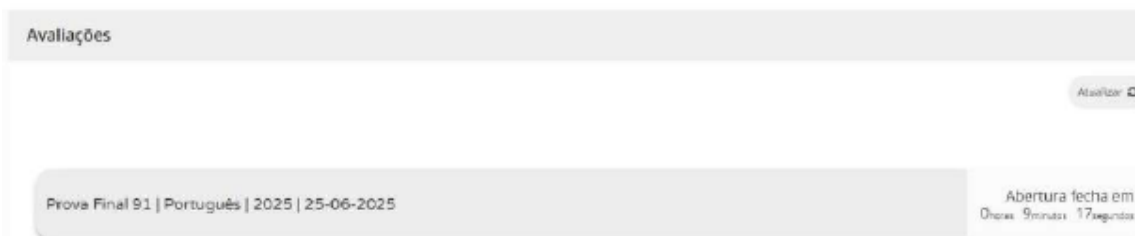
Figura 2 – Acesso à prova a realizar

11.11. Nas provas, ao clicar em “Iniciar sessão”, por exemplo, para um aluno que realiza a prova final de Português (91), aparece o seguinte ecrã: